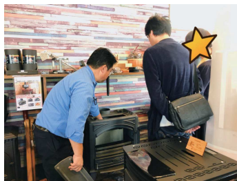
薪ストーブの特徴や使い方をご説明