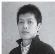
11/10 藤田 渉 藤田渉建築設計事務所