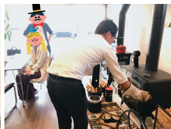
家づくり相談中に薪ストーブでピザを♪